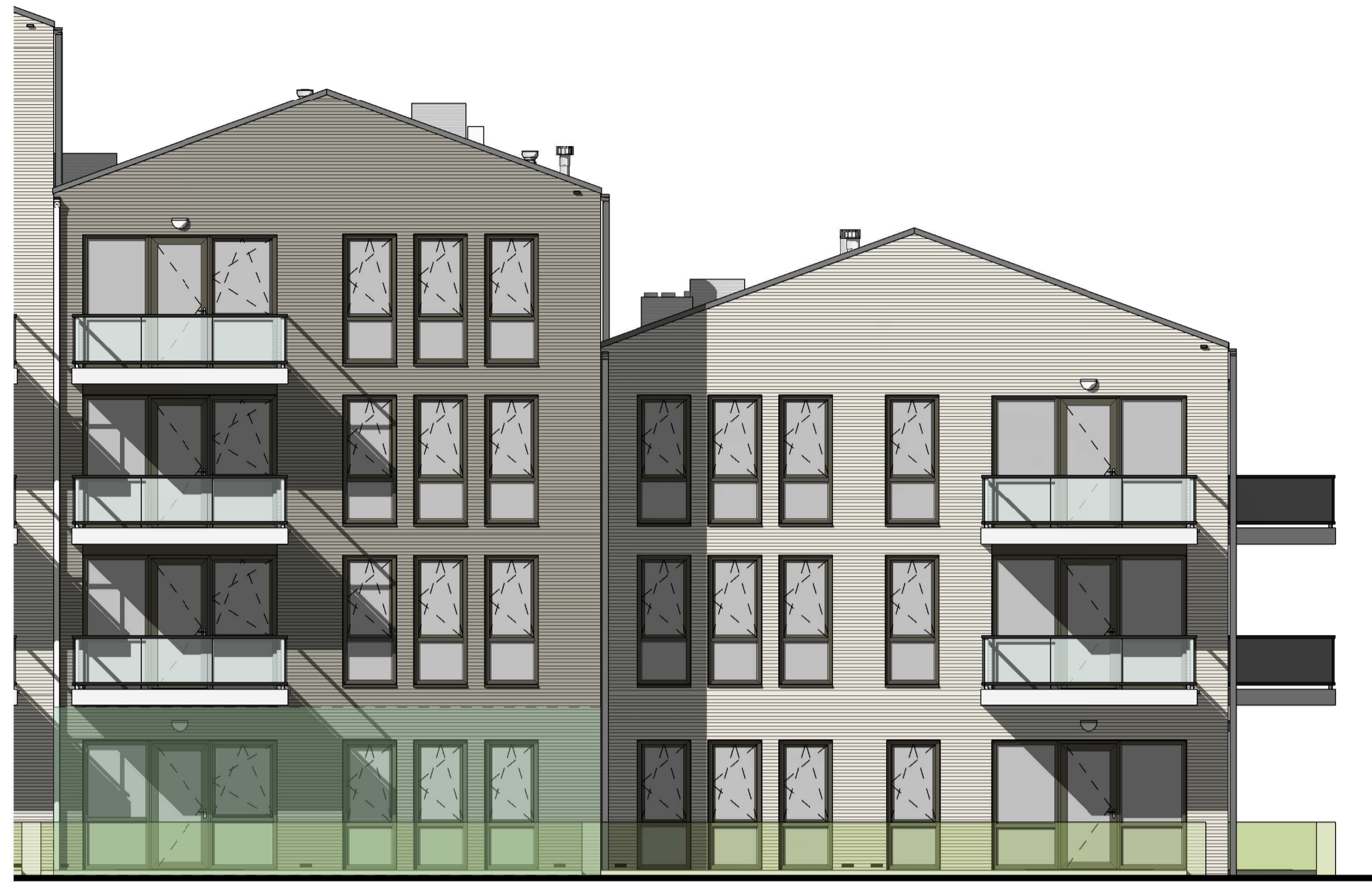
1:100 Gevelfragment - noordgevel